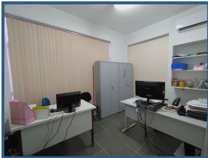
Imagem Ouvidoria Física

Dessa forma, a Ouvidoria física facilita o exercício do direito à informação pública do Executivo Municipal ao cidadão que não possui acesso aos meios eletrônicos.