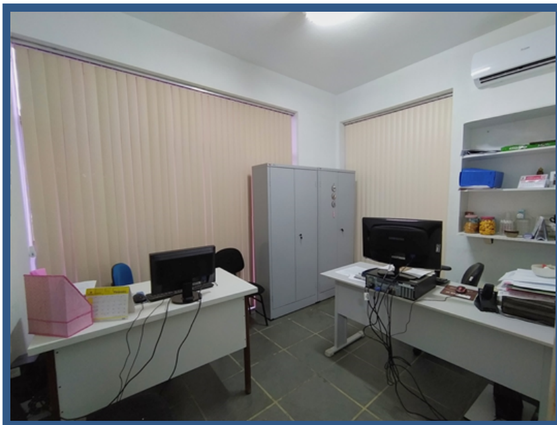
Imagem Ouvidoria Física

Dessa forma, a Ouvidoria física facilita o exercício do direito à informação pública do Executivo Municipal ao cidadão que não possui acesso aos meios eletrônicos.